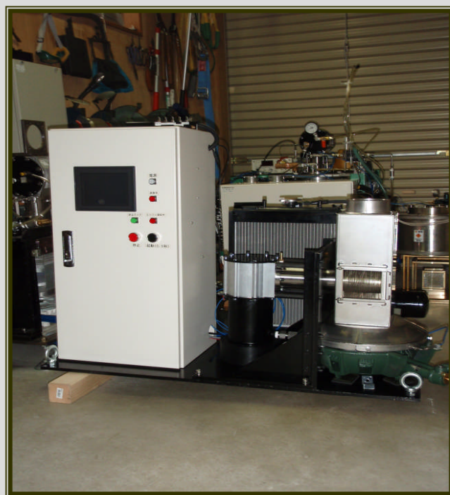
Mo3SE LPG熱源ユニット全景

百瀬機械設計株式会社、株式会社ケーエスケー、有限会社ミノモ計販、松本テクニコ株式会社は 共同でMOMOSEエンジンの普及事業に取り組んでおります。